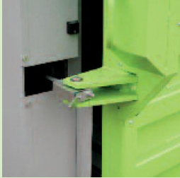
Der hydraulische Türöffner