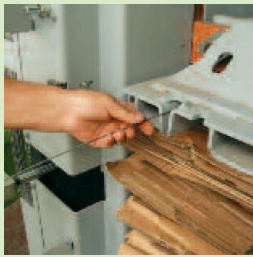
Einfachste Abbindung mit Draht**